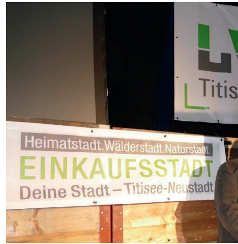
Bannermuster - hier 3 x 0,5 m